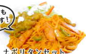
ナポリタンセット