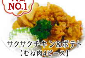
サクサクチキン&ポテト 【むね肉4ピース】 750円