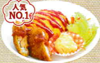
ミニふわオムセット