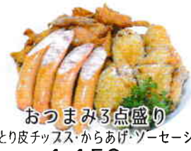
おつまみる点盛り 【とり皮チッス・からあげ・ソーセージ】 1,150円