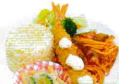
ふわとろ弁当 バターピラフ